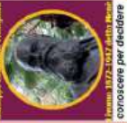
Gruppo Ecologico Biologiani L'anno 1972 1973 1974 conoscere per decidere

Le Associazioni promotrici della giornata celebrativa del